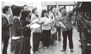
アクテノン・ワークショップ Vol.3 「舞台照明講座」 平成21年3月7日～8日 アクテノン・リハーサル室にて

2月末にアクテノンで開催された照明講座に参加しました。参加したきっかけはチラシに「照明プランの作り方」とあったからです。ありがたいことに岐阜県の場合、高校演劇でホールを使わせてもらう場合、専門家の方の指導を受けながら高校生が照明の仕込みをします。というわけで演劇部の顧問も照明機材の扱いは公演前の照明仕込みの時に灯体の吊り込みやシュート、介錯などをしながら学んでいきます。しかし、照明プランの作り方には困ってました。なぜかという高校演劇の場合上演前のリハーサルは20分しかないの、ほとんど音量チェックに時間を使い、照明の具合をじっくりと見るなどできません。しかも日頃の練習場所である体育館ではどうしても照明機材に限度があるので、ホールの照明を完全に再現することはできません。だから、この芝居にどうい