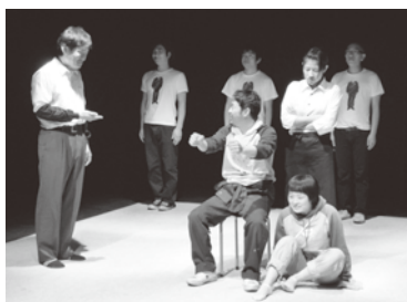
オイスターズが送る珠玉の短編集 「劇玉」 '09年3月27日～29日 G/pitにて